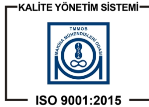
Şekil 2: MMO KYS Belgelendirme İşareti